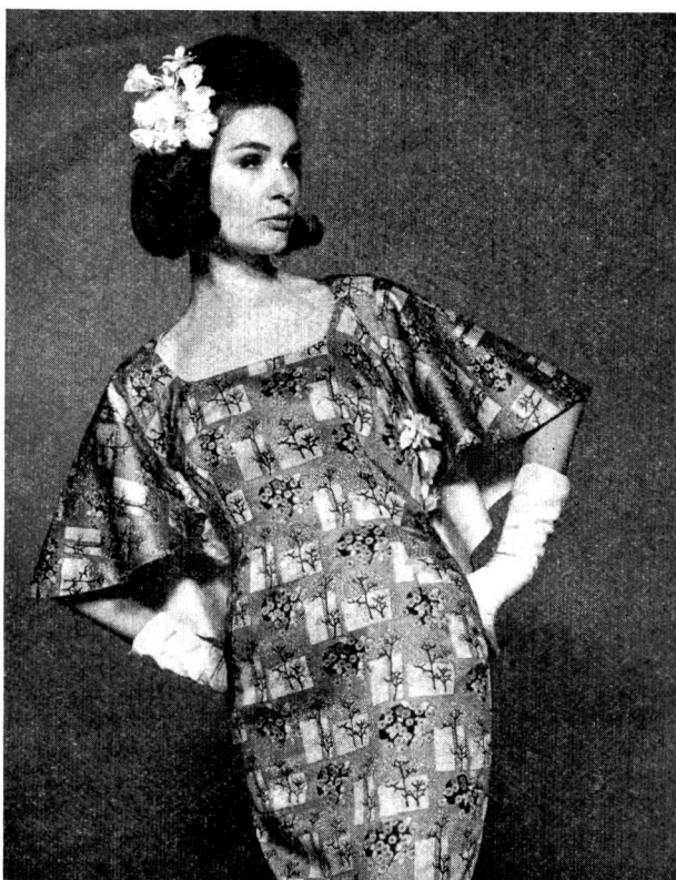
Cocktailkleid aus bedrucktem Baumwoll-Twill Modell: Couture Rita Peterli, St. Gallen.

Die Publizitätsstelle der schweizerischen Baumwoll- und Stickereiindustrie führte ihre traditionelle Modeschau Ende Mai in Zürich der Inlandpresse vor. Die Schau stand unter der Aussage «Hochqualitative Industrieprodukte —