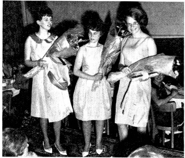
Die Preisträgerinnen, gekleidet in ihre Kreationen