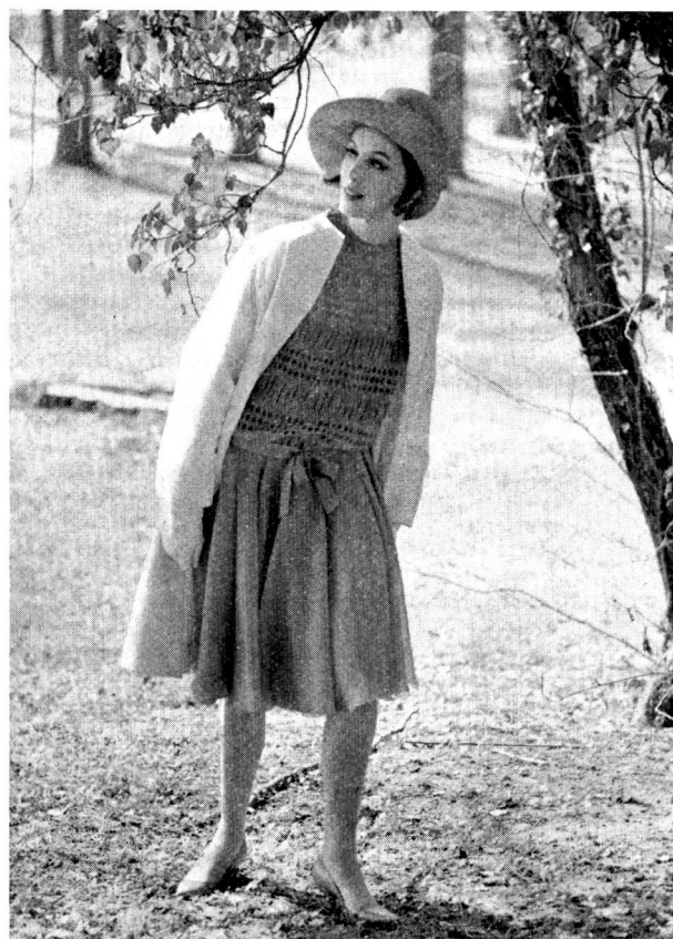
Weißer Mantel in Ottomane-Bindung aus Kammgarn Trevira 55 %, Schurwolle 45 %, und pastellfarbenedes rosa Chiffonkleid aus Trevira-Profilschurwolle

Ganz anspruchsvoll präsentieren sich im Sommer 1965 die Aetz- und Spachtelspitzen. Auch sie sind mehr dem Floralen verhaftet, weisen dekorative Applikationen auf und scheinen sich an Kostbarkeit zu übertreffen. Ausgeprägte Blattsticheffekte, fast frottéähnliche Schnürligui-pure, Chenillestickereien mit Aetzapplikationen und außerordentlich breite Guipure- und Spachtelspitzenborduren auf Tüll, Organdi und Voile lassen auf eine kostbare Sommerabendmode schließen. Samt wird mit Tüll schachbrettartig kombiniert, kontrastreiche Farben wie Rot und Grün ergeben eine phantastische Wirkung bei der Spachtelspitze aus Samt. Uebrigens werden die Aetzspitzen auch in einfacheren, aber nicht minder reizvollen Dessins hergestellt, damit auch die Frau mit kleinerem Kleiderbudget im nächsten Sommer Schweizer Spitzen tragen kann.