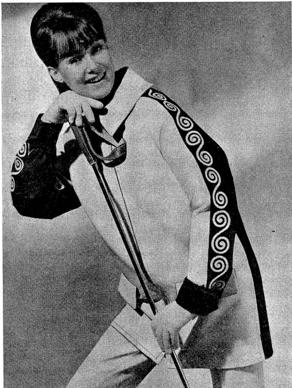
«Ensemble de Promenade» Lahco SA, Baden

«Während nun seit langem für die traditionelle Damen- und Herrenbekleidung tonangebende kreative Modezentren in Paris und Florenz bzw. London, Köln und Rom bestehen, die alljährlich Farben, Schnitt, kurz, den Stil der Mode bestimmen, war bis vor drei Jahren die Freizeitmode völliges Niemandsland. Damals hat der Swiss