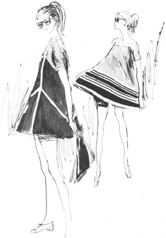
Trotz Minimode fördert das Trevira Studio International den Stoffkonsum. Die Trägerinnen haben sich vom «etwas längeren» Minijupe befreit und sichtbar sind die Bundhöschen aus dem gleichen Stoff

Dank diesen Ausführungen des Exportleiters der Farbwerke Hoechst AG stand die Trevira-Studio-Modenschau ausgesprochen unter dem Aspekt textilen Schaffens. Die vorgeführten Modelle waren ein Ausschnitt aus neuen Trevira-Gewebeentwicklungen , die in Struktur, Dessinierung und Farbnuancen auf die Moderichtung von Früh-