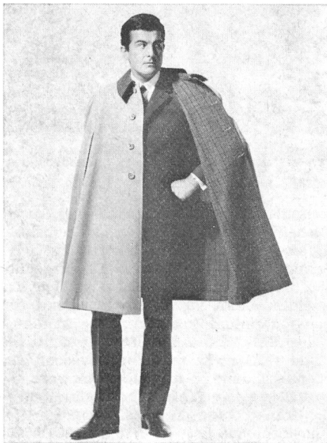
The MANline is Terylene Cape für den Herrn außen: Terylene/Cotton innen: Terylene/Wolle Hersteller: Bartsons, Belgien

Was nun aber an der Herrenmodewoche als modisch bzw. neu vorgeführt wurde, war im extremen Sinne einerseits eine Rückwärtsbewegung zur Romantik mit femininem Einschlag und andererseits eine Vorwärtsbewegung zum sog. «Indian- und Mao-Look». (Diese letztere Tendenz dürfte wiederum beweisen, daß die Mode ein Spiegel der Zeit ist, in dem sich die weltpolitischen wie auch sportliche Ereignisse spiegeln, und zwar in Schnitt und Farbe.) Es ist aber nicht besonders schwierig, à tout prix extreme Formen zu gestalten, jedoch um innerhalb des