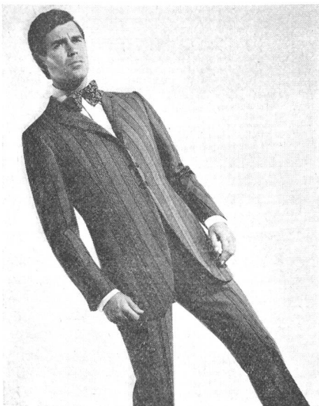
RITEX-Création 1968 Anzugsmodell im Town-Dress Die Taschen sind in der seitlichen Längsnaht Material: feiner Cheviot mit Bündelstreifen brown/brown

Arbeitskräfte, das sind fast 16 %, verloren. — Die derzeitige geschäftliche Entwicklung bei den anlaufenden Verkäufen für den Sommer 1968 läßt nun erfreulicherweise gewisse Aufwärtstendenzen erkennen, die zeigen, daß die Lager des Einzelhandels weitgehend geräumt sind und daß auch das Gespenst der Altwarenbestände durch die höhere Entlastung auf Grund der Einführung der Mehrwertsteuer seinen Schrecken verloren hat.»