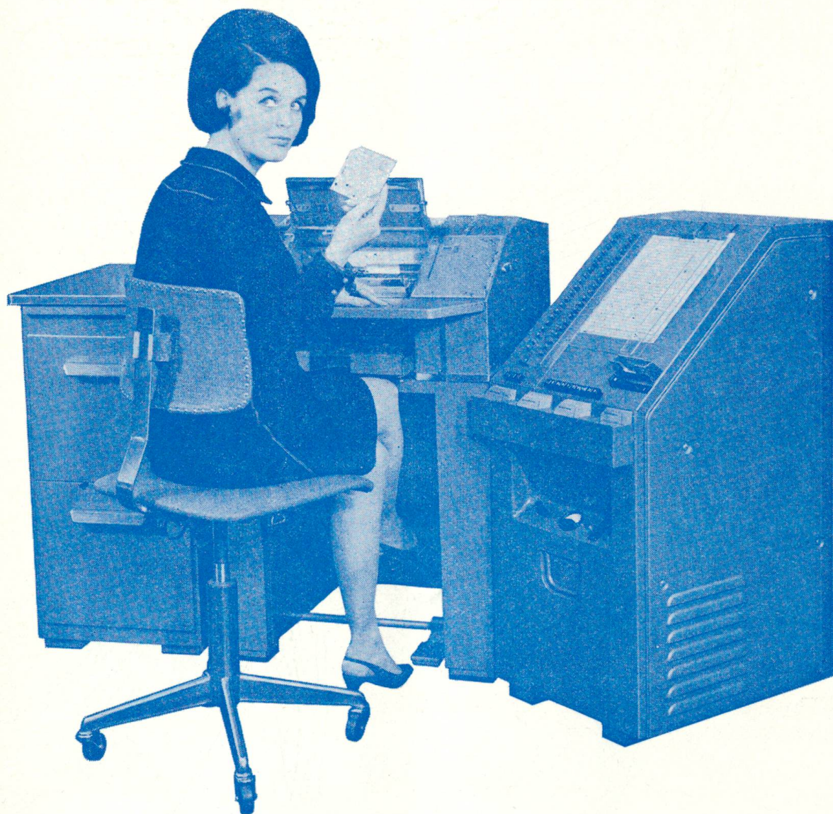
Modell Electronic 20 Modelle für jede Betriebsgröße und jeden Arbeitsanfall