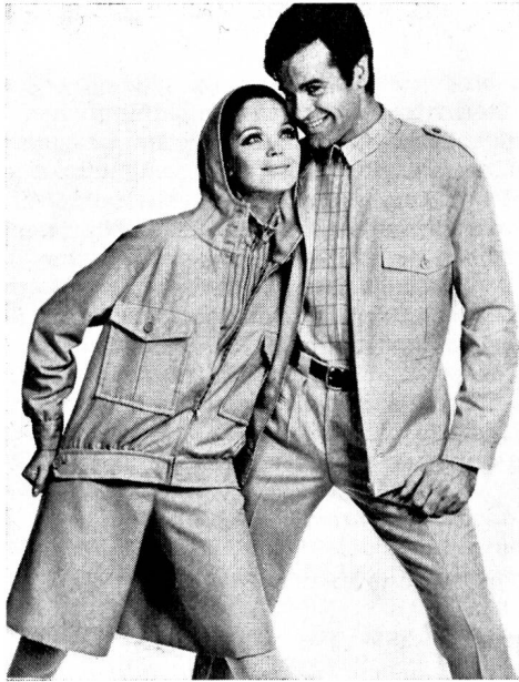
Herren-Freizeitanzug mit blousonartig gearbeiteter Jacke (leider ohne Krawatte). Als Pendant dazu eine Damen-Kombi mit Hosenrock Material: 55 % Vestan-Kammgarn / 45 % Schurwolle Modelle: Lauer-Böhlendorff, Krefeld

Mit der Schaffung eines Baumwolltyps ist es Vestan 21 sehr rasch gelungen, auch auf diesem Gebiet Fuß zu fassen. Neu im Angebot sind Regenmantel- und Anorak-Qualitäten in der Mischung 67 % Vestan 21 und 33 % Baumwolle. Weitere Entwicklungen auf dem Sektor Heimtextilien stehen kurz vor dem Abschluß.