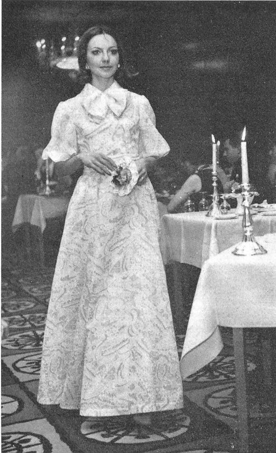
Langes, festliches Kleid aus Precios Ausbrenner Cotton/Diolen-Gewebe

Zahlreich sind auch die Variationsmöglichkeiten, die man beim Färben erzielt. Färbt man den Baumwollanteil, bleibt