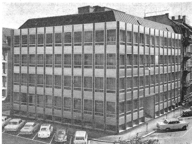
Neubau der Firma Adolphe Bloch Söhne AG, Zürich (ABZ), Tochterfirma der Weberei Wängi AG

Aus der Diskussion der Besucher bei einer Erfrischung nach dem anstrengenden zweistündigen Rundgang konnte man allgemeine Befriedigung über die Entwicklung des gemeindegrössten Unternehmens, gepaart mit Verständnis für die Probleme und Anerkennung für die Leistung der Textilindustrie, heraushören. Damit wurden Sinn und Zweck dieses Besuchstages voll erfüllt. (jm)