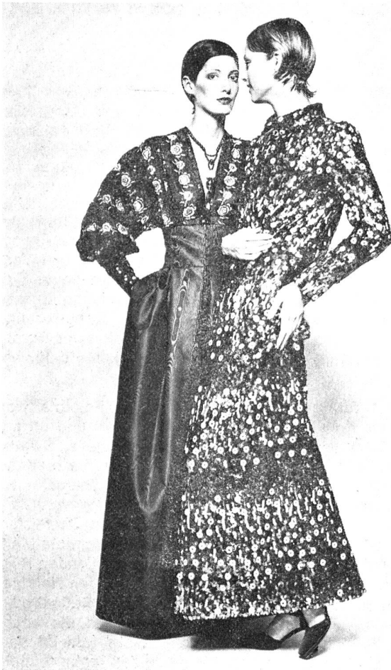
Links: Schwarzer Satingrund bestickt mit rosa, grünen und schwarzen Pailletten und Seide. Modell: Emanuel Ungaro, Paris; Rechts: Pailletten in Kupfer, rost, blau, lila, schwarz und silber. Modell: H. de Givenchy, Paris. Tissue: Beide Modelle Jakob Schläpfer & Co. AG, St. Gallen.

Elegante, blütenförmige Einsätze aus transparenten ►► und aus glänzenden Trikotstoffen schmücken dieses BH/Miederhöschenensemble aus Powernet mit «Lycra» Elastomermfaser. Modell: Familux, Belgien.