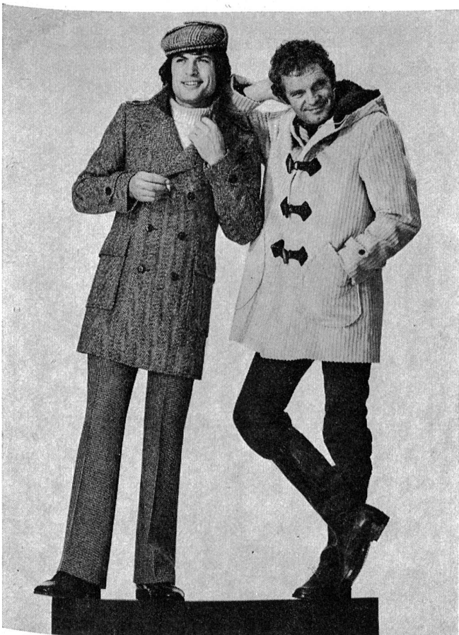
Cabananzug, d. h. lange Jacke, zweireihig im Kurzmantel-Stil und Duffel-Coat in Breitcord mit Kapuze

Sportsakkos im Norfolk-Stil in Donegalqualitäten sind neben Leinen die Renner. Hinzu gesellen sich — hier ist die Optik sehr wichtig! — Karo-Variationen, Glenchecks, Schottenkaros und neuerdings Vichi- und Madraskaros.