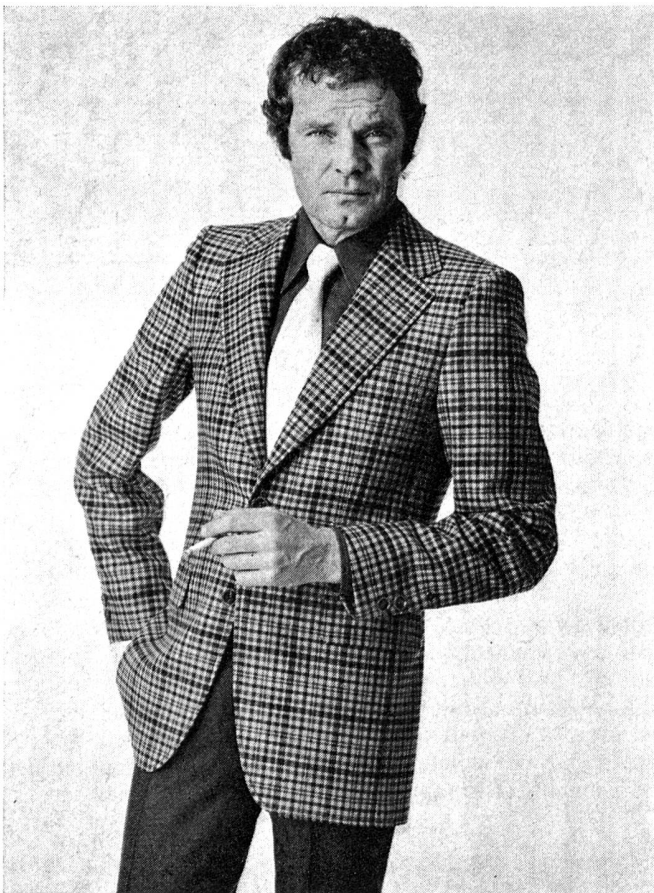
Set-Anzug: Passende unifarbene Hose zum gemusterten Sakko