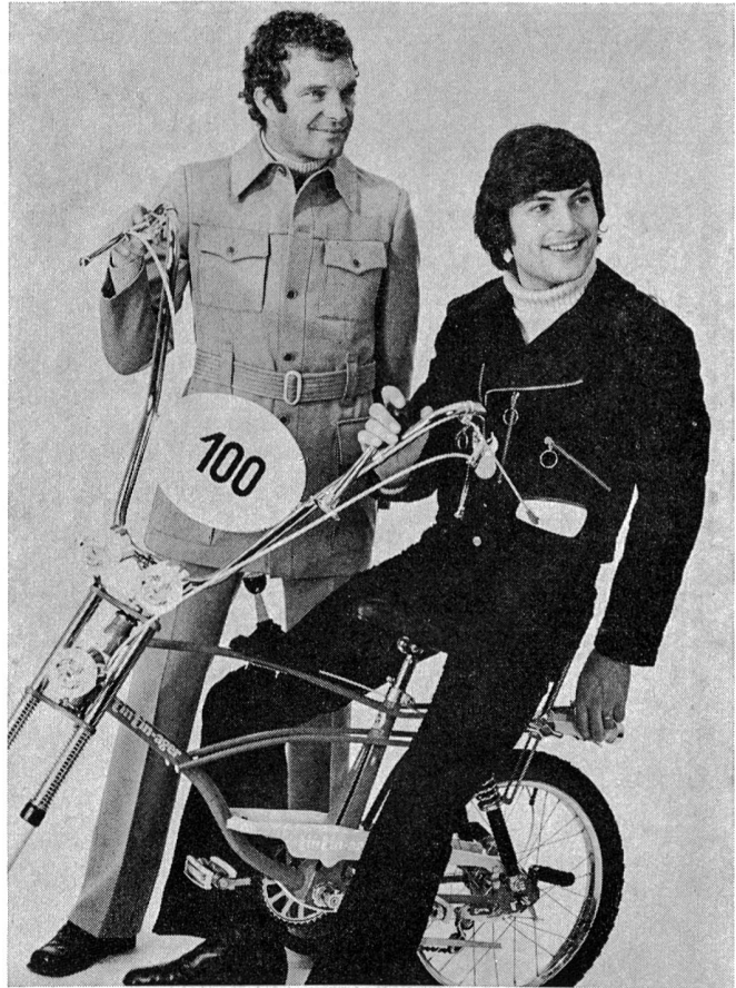
Links ein Safari-Modell, rechts ein Blousonanzug in kurzer Form

Geometrics und Ornamentics folgen erst jetzt, obwohl sie vor nicht allzulanger Zeit zu den Favoriten zählten.