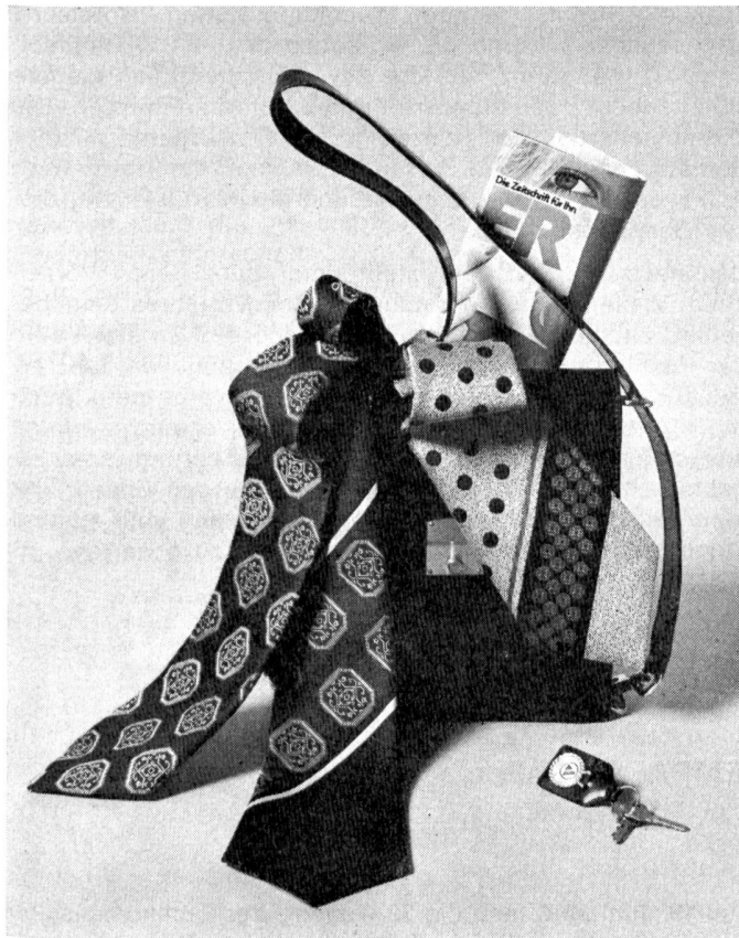
Elegante Tersuisse-Krawatten mit stilisierten Dessins: links ein Modell mit Einzelmotiven auf Unigrund in Braun/Beige/Weiss, in der Mitte das gleichfarbige Dessin als Bordürenstreifen; rechts eine Krawatte mit fantasievollem Punktdessin in Schwarz/Rot/Grau. Modelle: Laubscher & Spiegel AG, Zürich. Foto: Stephan Hanslin, Zürich.

Als weitere Begleitfarbe bzw. Kombinationsfarbe wird in verschiedenen Ländern auch schwarz vorgesehen. Es muss allerdings sehr sorgfältig eingesetzt werden, um allzu harte Kontraste zu vermeiden, die nicht modgerecht wären.