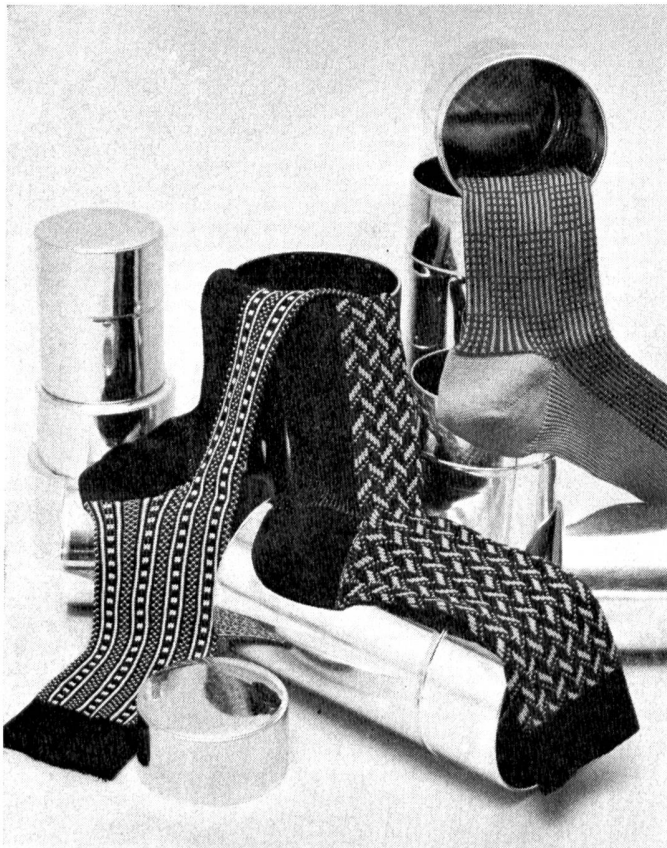
Modisch-attraktive, allover-gemusterte Nylsuisse-Herrensocken — links mit geometrischen Streifen in Anthrazit und Weiss, in der Mitte mit abgewandeltem Fischgratdessin in Bordeaux und Hellgrün, rechts mit Karoeffekt in Camel und Braun. Modelle: Jacob Rohner AG, Balgach.

Die Sommerstoffe 1974 sind zum Teil im Griff sehr trocken (z. B. Toilebindungen mit körniger Struktur), aber vorwiegend weich und geschmeidig. Materialien mit diskretem Glanz, z. B. Alpaca und Mohair, sind auch in Mischungen ebenfalls aktuell.