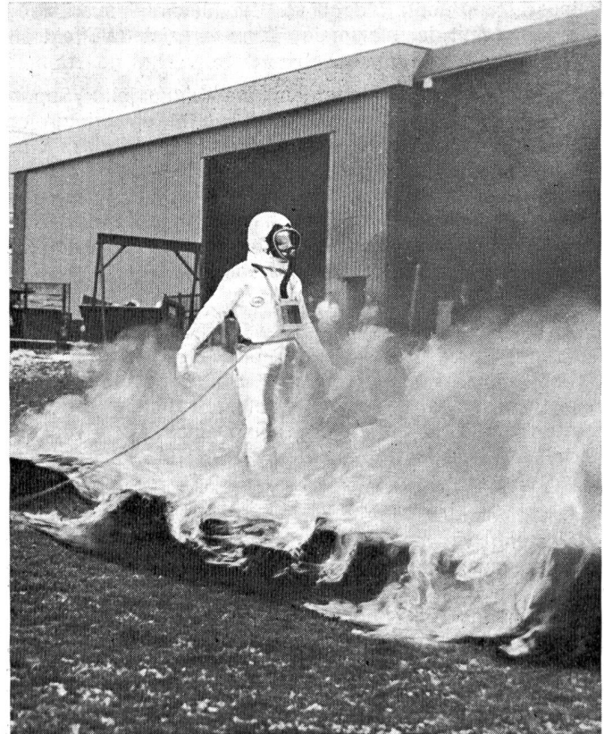
Abbildung 2 Bei der Schutzkleidung für Rennfahrer (Automobil- und Motorradsport) kommt es vor allem auf Schutz gegen intensive Hitzeeinwirkung während kurzer Perioden an. Hier bewährt sich Kleidung, die aus einer oder zwei Lagen flammfester reinwollener Unterwäsche und einem ebenfalls mit IWS-Flammfestausrüstung versehenen Overall aus etwa 85 % Wolle und 15 % Glasfaser besteht. Sie wurde von der Jim Clark Foundation für Grand-Prix- und andere Rennen empfohlen (BFF).

Versuche haben folgendes ergeben: Ein Thermolement, das der Flamme eines Mecher-Brenners (1300° C) ausgesetzt wurde, zeigte innerhalb von 30 Sekunden einen Temperaturanstieg um 300°. Bei Umhüllung des Thermolementes mit einer unbehandelten Wollstoffprobe bietet die Wolle einen Hitzeschutz für die ersten sieben Sekunden; dann aber wird die verkohlte Wolle zerstört, und es setzt ein bedeutender Temperaturanstieg ein (insgesamt erhöht sich die Temperatur binnen 30 Sekunden um 190°). Wird das Thermolement dagegen mit zirkonbehandelter