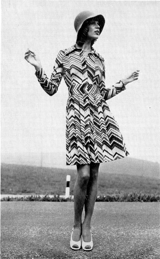
Ein bezauberndes Tersuisse-Chemisier in farbenfrohem Zickzack-Dessin. Das vorn durchgeknöpfte, langärmelige Modell mit schwingendem Faltenjupe wird in der Taille durch einen breiten Gürtel-einsatz betont. Modell: Iril SA, Renens; Foto: Studio Kriewall, Männedorf.

rativ-Sujets ihren Einfallsreichtum, auf den Fuss gefolgt von den nach wie vor beliebten Smok-Verzierungen.