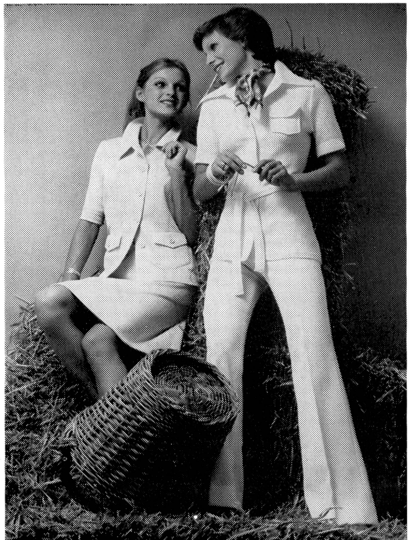
Für sportliche junge Damen, die sich für Jersey begeistern können: zwei Tersuisse-Modelle — beide im Chemise-Stil mit Ripstrick-Oberteil und Tweed-Effekt. Der Jupe des Deux-pièces' ist unten leicht ausgestellt. Modelle: Alpinit AG, Sarmenstorf, Foto: Stefan Hanslin, Zürich.

Farblich abgestimmte Blenden, Passepoils und Einsätze sind nur einige der markanten Details der neuen Mode. Daneben entfalten wippende Volants, Hohlsaum-Stickerei-Partien, aber auch aufgestickte oder aufgedruckte Figu-