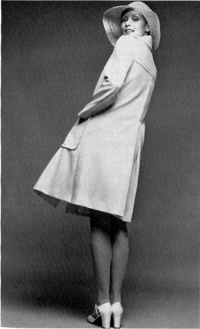
Eleganter Tersuisse-Mantel mit tiefem Rückenfalt, aus goldgelbem, formstabilem Jersey. Vorn hat dieser schwingende Einreihler mit Reverskragen zwei grosse, aufgesetzte Taschen. Modell: Bürgisser-Reimann AG, Zürich; Foto: Andreas Gut, Zürich.