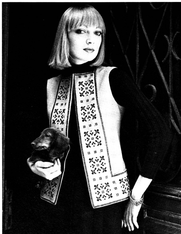
Broderie beige et noire sur Volalba chameau. Broderie: Jakob Schlaepfer, St-Gall; Photo: Peter Kopp, Zurich.