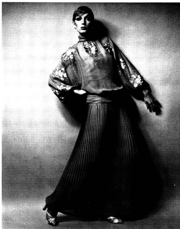
Broderie rose, lilas, moutarde et beige sur georgette de soie beige. Broderie: Jakob Schlaepfer, St-Gall; Photo: Peter Kopp, Zurich.

Sportliche Serie auf Flanell mit kleinen figürlichen All-overs, oder nur Bordürenstickerei, zwei- bis dreifarbig.