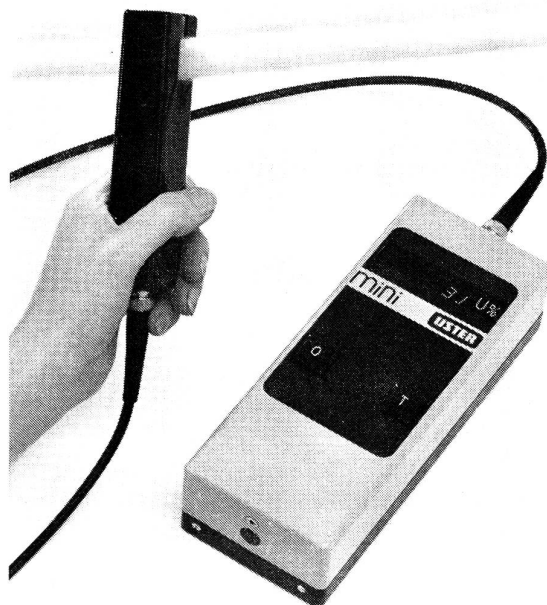
Der neue Mini-Uster

Das Gerät arbeitet im Prinzip gleich wie der Gleichmässigkeitsprüfer mit Integrator. Es misst mit einem kapazitiven Messkopf den Materialquerschnitt, wertet die Ungleichmässigkeit aus und zeigt die U % an. Im Unterschied zum Uster-Gleichmässigkeitsprüfer ist der Mini-Uster klein und leicht, so dass er zum Messen in der Hand gehalten werden kann. Für die verschiedenen Nummernbereiche vom Band bis zum Garn sind auswechselbare Messköpfe vorgesehen, die am Basisgerät angesteckt werden können. Es ist auch möglich, den Messkopf an einer Maschine zu befestigen und über ein Kabel mit dem Basisgerät zu verbinden. Das Gerät ist batteriebetrieben. Die Kapazität der Akkus reicht für einen ca. zweistündigen Dauerbetrieb aus, d. h. es können pro Ladung 50 bis 100 Messungen vorgenommen werden.