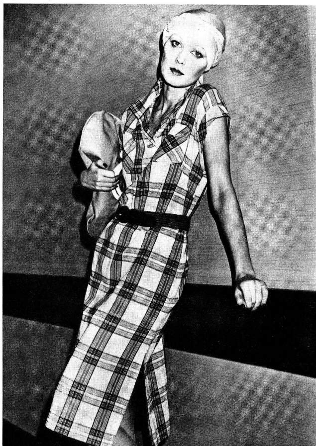
Auch sportliche Mädchen geben sich gerne elegant: Im Shiftkleid aus leichtem Baumwoll-Cheesecloth mit Madras-Karo werden sie sich bestimmt wohlfühlen. Sehr aktuell in diesem Sommer ist der hohe Seitenschlitz und der Knebelverschluss. Stoff von Mettler & Co. AG; Modell: Mickhausen; Foto: Swiss Cotton Centre/Ch. Moser.

In den Kollektionen bedruckter Hemdenstoffe bleibt es bei der Bevorzugung klassischer Mini-Dessins auf hellen Fonds der Richtung écri, champagner und beige mit sehr feinen Gravuren und Rasterzeichnungen, die als typisch Schweizerische Spezialität modische Kreativität