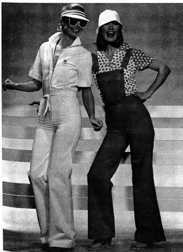
Sommerzeit ist Ferienzeit! Da braucht man Hosen, die nicht nur praktisch sind, sondern auch ein bisschen Pfiff haben, wie diese Gabardine-Modelle aus Trevira mit Baumwolle. Der Overall wird in der Taille einfach zusammengezogen; unter der Latzhose trägt man eine leichte Jerseybluse aus Trevira.

mit hervorragender Beherrschung der Technik verbinden. Neu sind Versuche, auch für das Tageshemd Dessins bis zu mittleren Rapporten, vorzugsweise in Diagonal- und Karostreifen zu bringen, sowie bei buntgewebten Hemdenstoffen vielfältige neue Ideen von Streifen und Streifenbündeln mit den ergänzenden Karodessins. Cheesecloth und Indian-Crêpe sind für das Freizeit-hemd stärker ausgemustert mit neuen aparteren, auch mehrfarbigen Colorits.