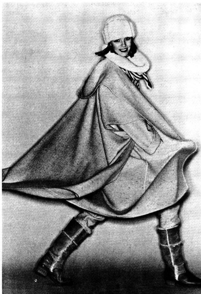
Ein ungefütteter Poncho-Mantel mit Kapuze aus irischem Schurwoll-Tweed mit passender Stiefelhose. Dazu wird ein rot-weisses Streifenpullover mit schwarzen Blenden getragen. Mütze und Schal aus weissem Grosstrick ergänzen diesen sportlichen Outfit. Modell: Jean-Claude de Luca; Foto: Wollsiegel-Dienst.

Farben kombiniert. Für die Avantgarde sind Verbindungen der Violett-, Rot-, Pink- und Blauskala aktuell. Star ist ein grelles Tintenblau. Grünstichiges Blau (Petrol, Pfau) und Türkis gesellen sich zu Olive und Weiden-grün. Leuchtende Rottöne strahlen Wärme in den Mode-winter. anke