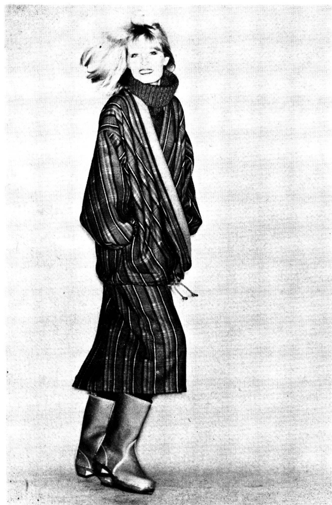
Ein Kostüm mit neuen Proportionen — entworfen von Issey Miyake. Die lange und sehr blusige Jacke mit tief angesetzten und geräumigen Aermel wird im Vorderteil schräg übereinander geschlossen und in Hüfthöhe durch ein Kordelband eingehalten. Dazu wird ein schmaler Wickelrock getragen. Das Material ist ein rot kariertes Double-face aus reiner Schurwolle mit senfarbener Abseite. Modell: Issey Miyake; Foto: Wollsiegel-Dienst.

Naturtöne (von Beige bis Dunkelbraun), Gewürzfarben (Senf und Muskat, Pfeffer und Zimt, Curry und Paprika) und Metallnuancen (Gold, Kupfer, Messing, Stahl und Rost) stehen im Vordergrund. Sie werden — ebenso wie Schwarz und Ecru — mit warmen, leuchtenden