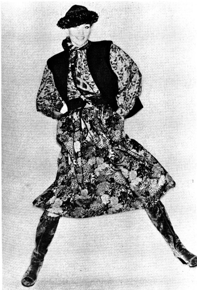
Yves St. Laurent wählte zwei verschieden bedruckte Chaly-Gewebe aus reiner Schurwolle für Rock und Bluse. Die Farben: rostiges Orange, Grau- und Brauntöne. Dazu wird eine Bolero-Jacke mit kontrastierenden Blenden getragen. Modell: Saint Laurent rive gauche; Foto: Wollsiegel-Dienst.

Der Hosenmantel im Parka-Stil mit Reissverschluss aus federleichten Schurwoll-Double, aus breitgeripptem Cordsamt und gestepptem Popeline hat immer eine «Woll-Seele» — nämlich ein wärmendes Futter, uni oder schottisch kariert. Geräumige Grobstrickmäntel in leuchtendem Farbenspiel (Inka-Folklore) machen bei Dorothe Bis Furore, während St. Laurent für seine Kosakenmäntel