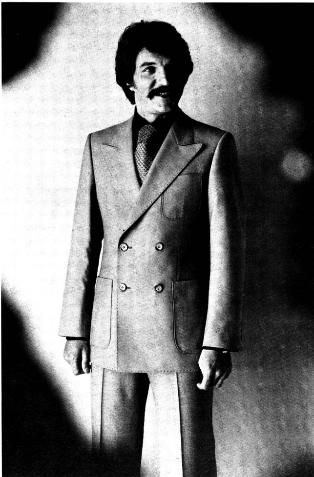
Bergamo — Ein aktuelles Blazermodell mit vielen modischen Details wie: drei aufgesetzte Taschen, zweireihig, markierte Hand-Stitch-Stepperei, Spitzrevers.