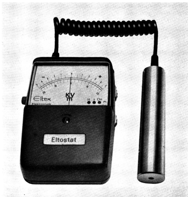
Abbildung 5 Eltex-E-Feld-Messgerät EM 01. Handliches Kleingerät mit separater Messsonde zum Messen elektrostatischer Aufladungen an Fäden und Bahnen.

Auch durch die Verwendung eines speziellen Pulvergemisches (Schwefel und Mennige) — mit dem das zu untersuchende Material bestreut wird — kann der Nachweis von statischer Elektrizität geführt werden. Durch Schütteln (Coehnsche Regel) laden sich die Schwefel negativ und die Mennige positiv auf. Die Schwefelteilchen haften an den positiv und die Mennige an den negativ geladenen Stellen der Oberfläche. Auf diese Weise lässt sich auch sichtbar machen, dass Materialien auf der einen Seite möglicherweise positiv