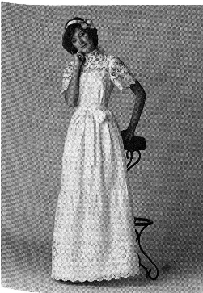
Modell: Chessa & Bruno, Mailand; Stoff: Stickerei von Willi Jenny & Co., St. Gallen; Foto: Silvio Nobili, Mailand.