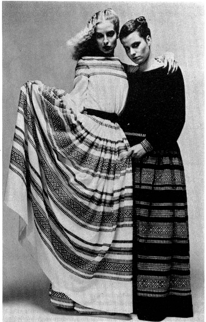
Modèle: Balmain Couture, Paris; Tissu: Georgette de coton brodé de Forster Willi & Co. AG, St-Gall; Photo: Wilfried Rouff, Paris.

de-Chine, Honan, Leinen, Mousseline, Georgette imprimé und uni.