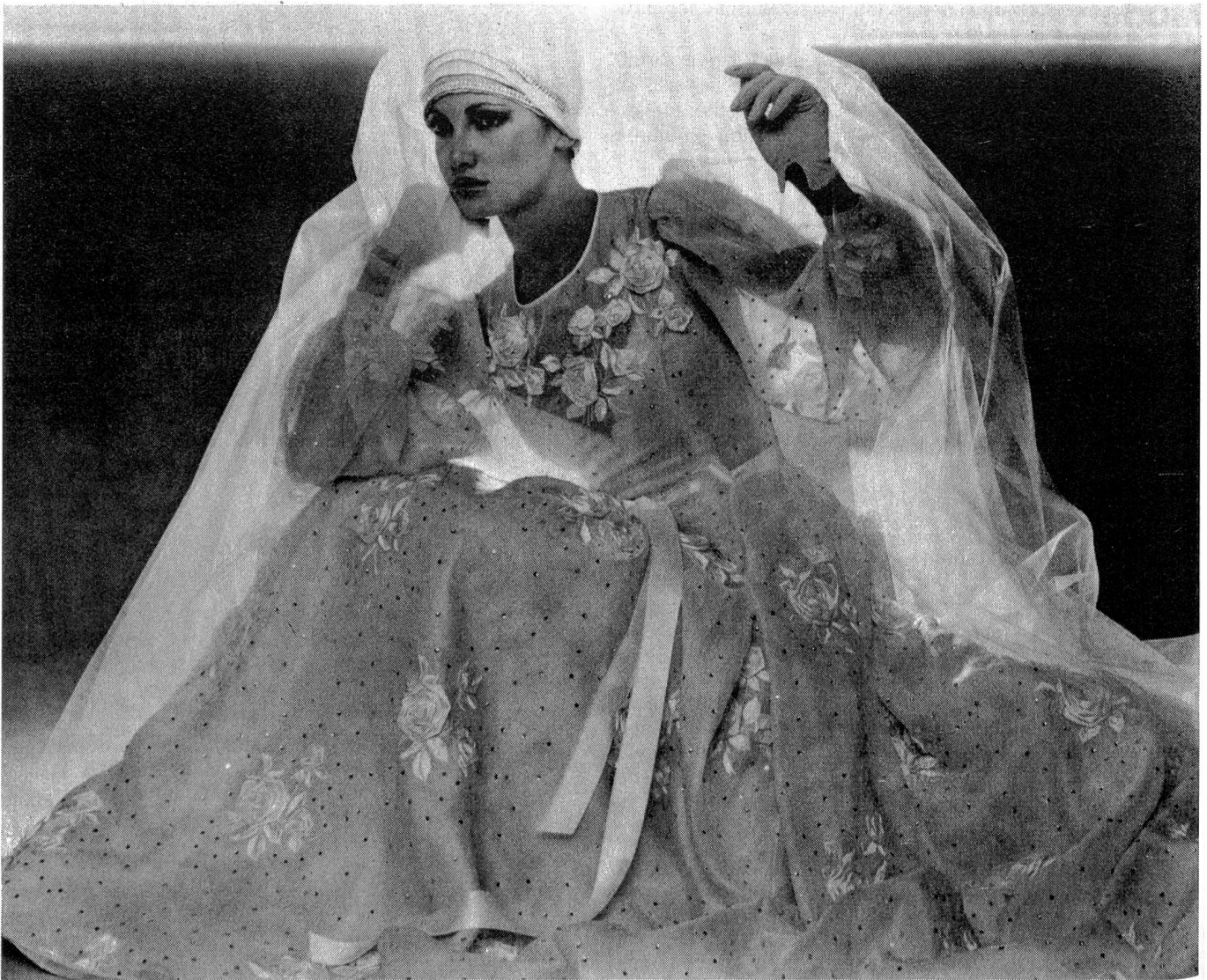
Robe de mariée en Organza Satin blanc avec broderie blanche, garnie de roses en ruban blanc et entièrement diamanté. Modèle: Pierre Balmain, Paris; Broderie: Jakob Schlaepfer, St-Gall; Photo: Peter Knapp, Paris.