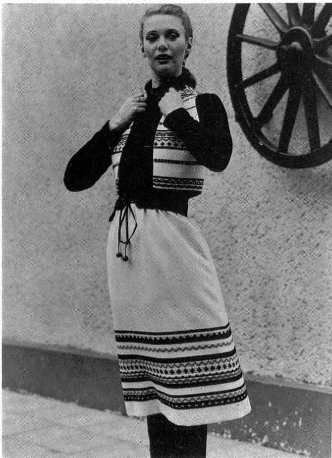
Ein Kleid im Folklore-Stil mit schlankmachendem schwarzen Ober- teil aus feinem Rippengestrick. Rock und Bolero wurden aus weissem Wollsiegel-Flanell mit Bouclé-Bordüren gearbeitet. In diesem Modell kann sich die Lady Wool zu jeder Tageszeit sehen lassen. Wollsiegel-Modell: Radtke & Radtke, München; Foto: Wollsiegel-Dienst/Capellmann.

kombiniert werden. Auffällige Reissverschlüsse, Passen und Lederblenden, Riegel, grosse Druckknöpfe, Strickbündchen bändigen zuweilen allzu Voluminöses.