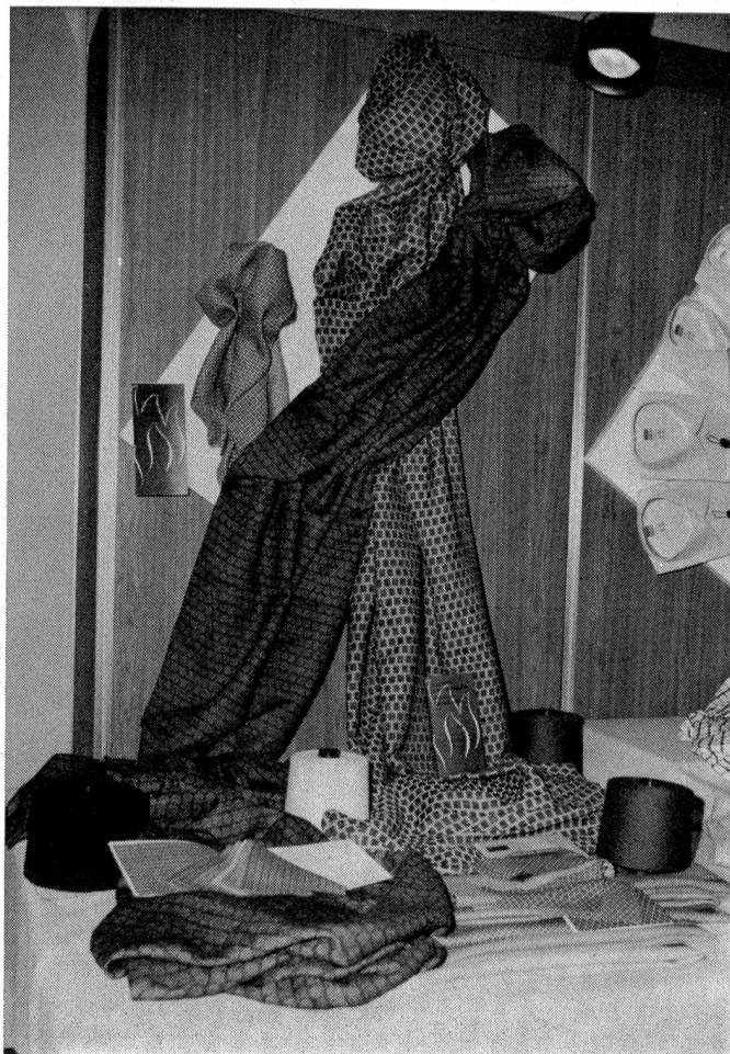
Schwer entflammare Viskosespinnfasern für Arbeitsbekleidung sowie Dekorstoffe.

Die von Lenzing entwickelten schwer entflammaren Viskosefasern werden derzeit auf einer Versuchsanlage