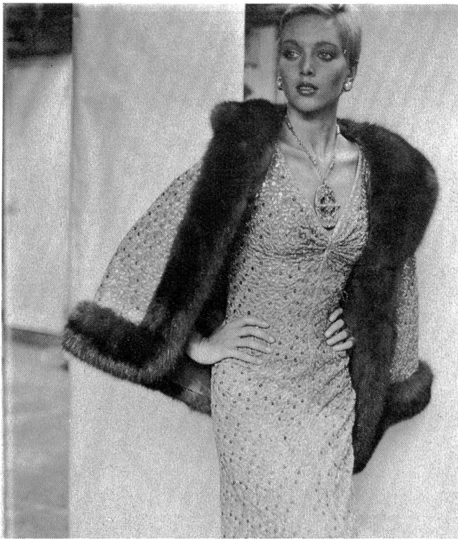
Chanel, Paris — Broderie en lamé or avec paillettes or sur chiffon de soie beige. Broderie: Jakob Schlaepfer, St-Gall; Coiffure: J.-M. Maniatis, Paris; Photo: Peter Knapp, Paris.