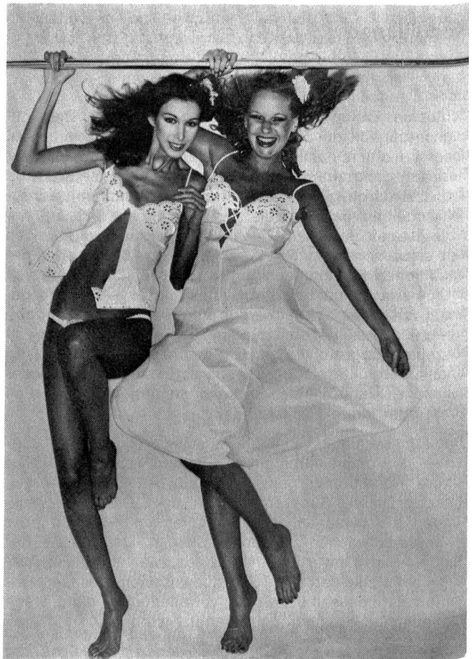
Modelle: Lingerie Habella, Frauenfeld; Material: Broderie Anglaise auf Baumwoll-Batist von J. G. Nef & Co. AG, Herisau; Foto: Onorio Mansutti. «Schweizer Textilien»

Die neuen Kollektionen mit den Nachtwäsche- und Lingeriemodellen aus Schweizer Textilien sind da! Sie sind aus schmeichelnden Tersuisse-Qualitäten gefertigt, mit raffinierten Décolletés und Spitzeneinsätzen oder aus feinstem Schweizer Baumwollbatist zu romantischen Nègligés verarbeitet. St. Galler Stickereien — bunt gestickte Blüten, kostbare Tüllgalons oder in handwerklicher Manier geschnittene Blumenmotive — verleihen diesen Kreationen ihren besonderen Reiz. Ob es sich um Modelle aus Broderie Anglaise handelt, inspiriert vom Corsage aus Grossmutter's Zeiten oder um Nachtwänder im Vampstil der 50er Jahre, sie lassen nicht nur Frauenherzen höher schlagen.