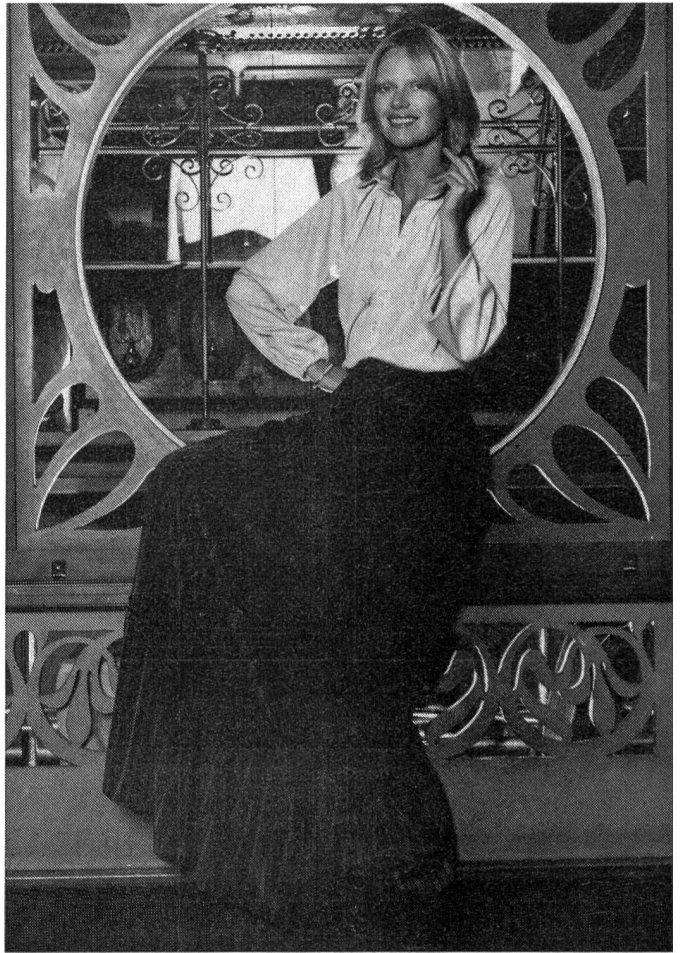
Langer Volantjupe mit Satinstreifen und weite Jerseybluse mit Raglanärmeln und weichem Kragen — mädchenhafter Chic im Stil Gigi. «ABC/Multex» A. Blum & Co. AG, Zürich.

Je später der Abend, desto luxuriöser die Stoffe, desto bauschiger die Jupes und Aermel, desto reicher das Dekor, oft Schwarz in Schwarz ausgeführt. Weich ausgerüsteter Taft, Seidenmousseline, Crêpe Georgette, Organza, Gaze de soie — belebt mit dem ganzen romantischen Repertoire Schweizer Stickereikönnens: zarten Ranken- und Blütenstickereien, Chenille- und