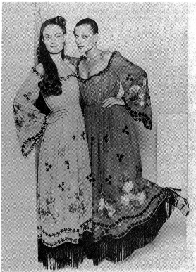
Broderie de soie multicolor sur crêpe georgette. Tissu: A. Naef, Flawil/Suisse; Modèles: Ted Lapidus, Paris; Photo: Bianchini. «Broderie de St-Gall»