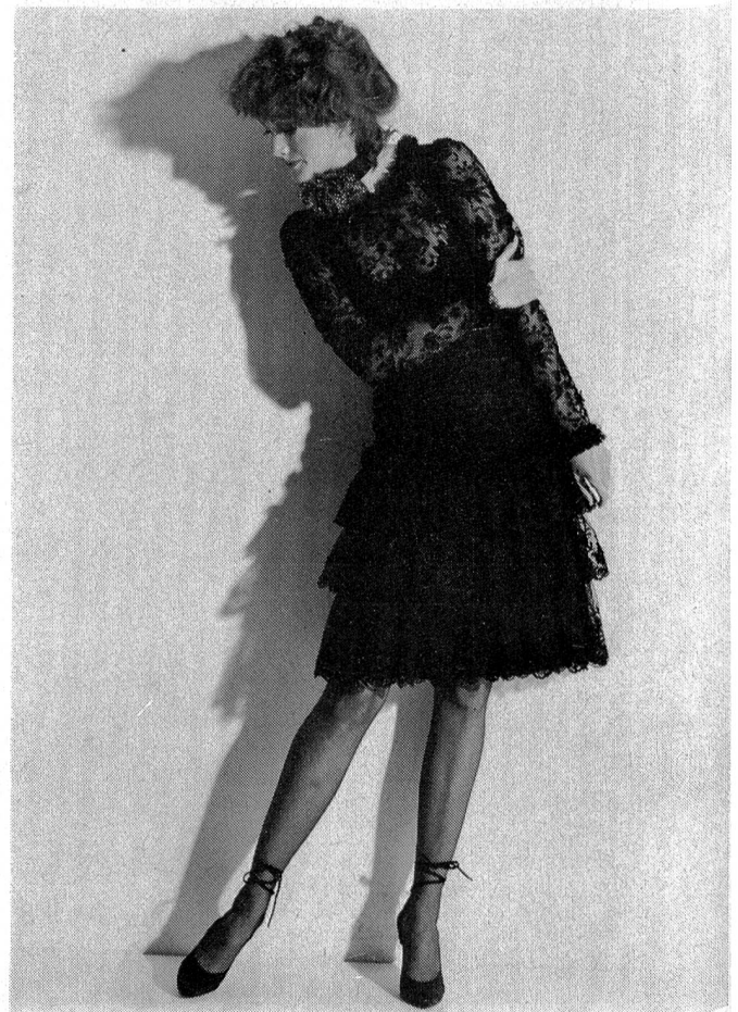
Broderie noire avec application de motifs en guipure sur tulle noir. Tissu: Jakob Schlaepfer, St-Gall; Modèle: Emanuel Ungaro, Paris; Photo: Peter Knapp, Paris. «Broderie de St-Gall»