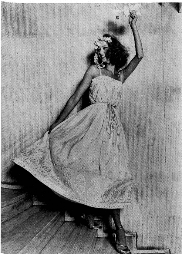
Mehrfarbig bestickter Seidenkrepp. Modell: Carven, Paris; Stickerei: A. Naef, Flawil (St. Galler Stickerei).

kostüm in Tweed und Flanell, als Warmcoat darüber eine betont breitschultrige Kastenjacke mit hohem Steppkragen, deren T-Silhouette typisch für die neuen echten Mäntel ist, von jupelang über den dreiviertellangen Paletot bis zur Cabanjacke. Eine dieser neuen markanten Jacken aus Schweizer Alcantara smocké in Beige machte Aufsehen bei Balmain.