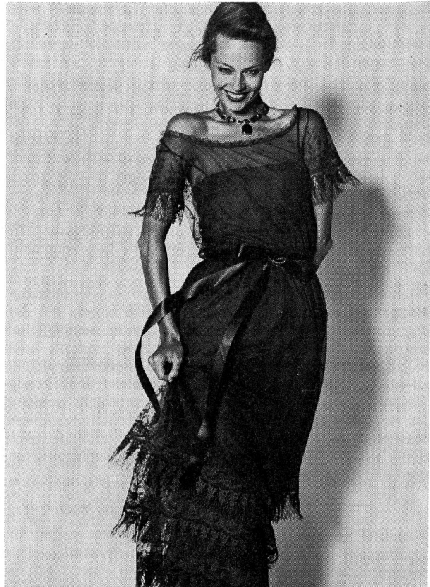
Kleid aus Baumwolltüll mit feinen Guipure-Applikationen. Modell: Dior, Paris; Stickerei: Forster Willi, St. Gallen; Foto: Dick Ballarian, Paris (St. Galler Stickerei).

Das schicke Tailleur-Ensemble war Star bei Yves Saint Laurent, er zeigte es in allen Variationen (auch mit Hosen, aber weniger als das letzte Mal), und auch in der Kombination mit Edelsteinfarben wie Rubin, Amethyst, Smaragd, Topas, die in den verwendeten Seiden-