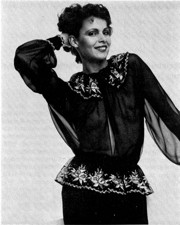
Bordure en broderie grise, saumon et violet sur Carma noir, garni de diamants. Broderie: Jakob Schlaepfer, St-Gall; Photo: Peter Kopp, Zurich.

wie man es trägt, wie man welche Modelle, welche Farben und Stoffe zusammenstellt. Die Modemacher lassen der Konsumentin viel Spielraum für eigene Kreativität.