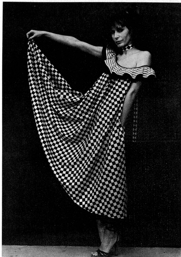
Stoff: Baumwollbatist bedruckt, Reichenbach & Co. AG, St. Gallen; Modell: Luis Mari, Nizza; Foto: Dave Brüllmann, Zürich. «Schweizer Textilien»

Die Franzosen zeigen, dass es im nächsten Sommer nicht so sehr darauf ankommt, was man trägt, sondern