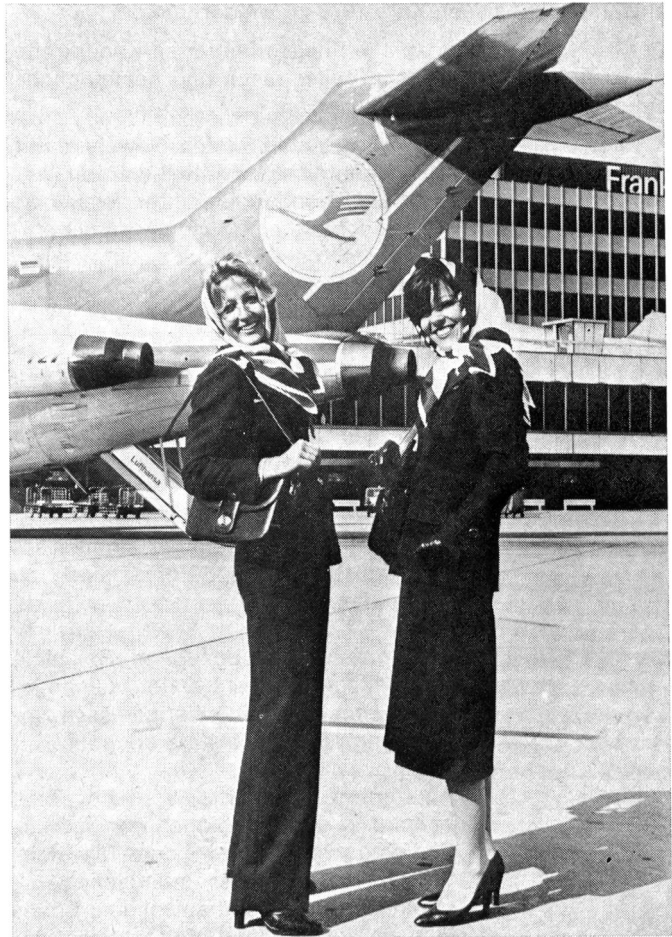
Wollsiegel-Chic für Lufthansa-Stewardessen.

Mit der Einkleidung wurde bereits in den letzten Monaten begonnen. Dabei stellte sich heraus, dass 90 % der Damen von dem Angebot, alternativ zu den Kostümröcken auch