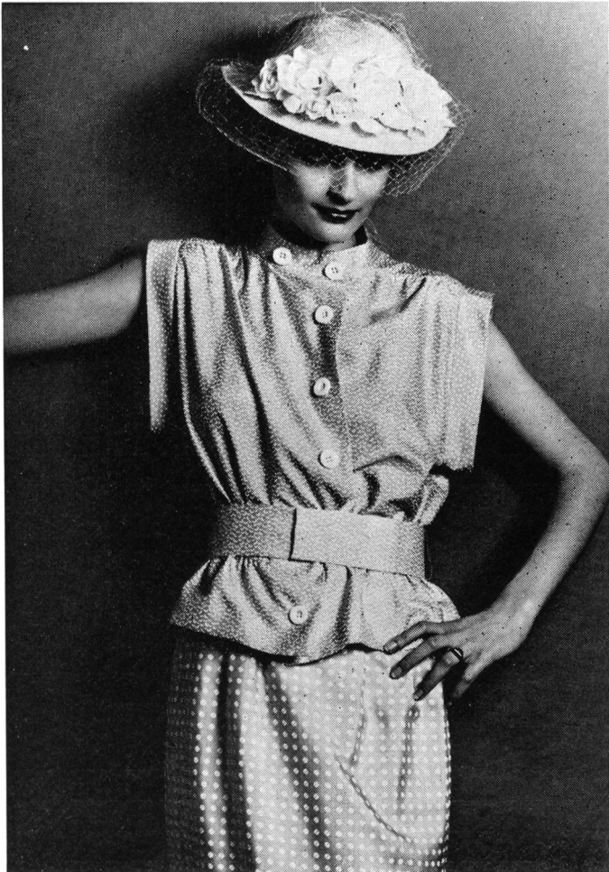
Abraham AG, Zürich; Modell: Csandra, Paris; Stoff: Honan-Seide bedruckt (100% Seide)

Der Übergang war sanft. Von weit schaltete die Mode zunächst auf schmal herunter; aber inzwischen ist man doch schon bei eng angelangt. Die Tendenzwende, die das französische Prêt-à-Porter vor einem Jahr, d. h. für diesen Win-