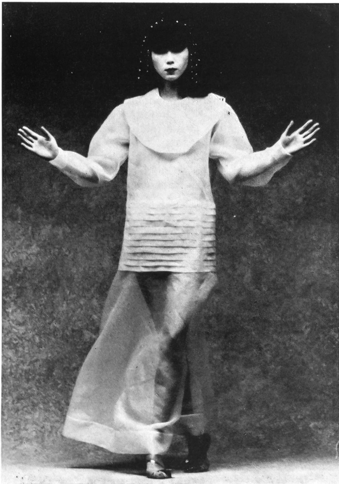
«Style égyptien» — Robe en organdi transparent à large collerette et plis plats au niveau des hanches.

Um diese erstmalige Art einer Modepräsentation durchzuführen, gab es für die Gebrüder Brunschwig, Besitzer der