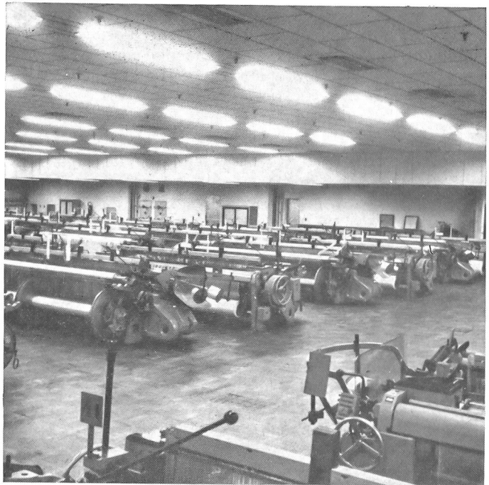
Sprinklernetz in einem grossen Textilunternehmen (0275 5072-3)

Eine Sprühflutanlage besteht aus einem fest installierten Rohrleitungsnetz und — im Unterschied zur Sprinkleranlage — offenen Düsen. Diese Löschanlage wird in jenen Fällen eingesetzt, wo mit einer sehr raschen Brandausbreitung gerechnet werden muss. Bei der Inbetriebnahme wird jeweils ein ganzer zu schützender Sektor ausgelöst. Die automatische Inbetriebsetzung wird nur in seltenen Fällen vorgenommen, weil bei einer Fehlauflösung ein erheblicher Wasserschaden entstehen kann. Vielfach wird die Sprühflutanlage durch die Feuerwehr — und zwar manuell — in Betrieb gesetzt. Gegebenenfalls kann sie mittels einer Pilotsprinkleranlage in Betrieb genommen werden. In Unternehmen der Textilindustrie werden Sprühflutanlagen u. a. installiert in Materiallagern für Stoffe, die rasch entflammen und abbrennen, und können in Kabelkanälen, Energiezentralen, Verteilstationen, Trafostationen usw. ebenfalls in Betracht kommen.