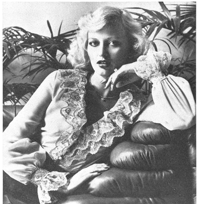
Festliche Bluse mit Doppelvolant und Manschetten aus reicher St. Galler Stickerei auf Tüll. — Stickerei: Forster Willi & Co. AG, St. Gallen. — Modell: Wollenschläger & Co., Blusen aus Baden-Baden.