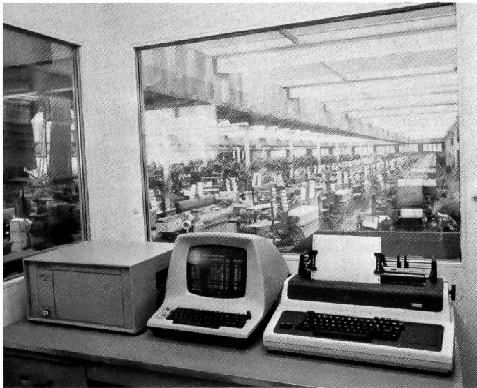
Abb.: Zentraleinheit, Drucker- und Videoterminal des Datensystems Uster Loomdata in einer Weberei

Als Drucker- und Videoterminal gelangen handelsübliche Modelle einfacher und bewährter Bauart zum Einsatz. Sie werden über Standardschnittstellen (RS232 oder Current-Loop) angesteuert und arbeiten voneinander unabhängig. Bereits der Anschluss eines Druckerterminals genügt zum Betrieb der Anlage. Der zusätzliche Anschluss eines oder mehrerer Videoterminals erhöht die Nutzungsmöglichkeiten des Systems jedoch wesentlich.