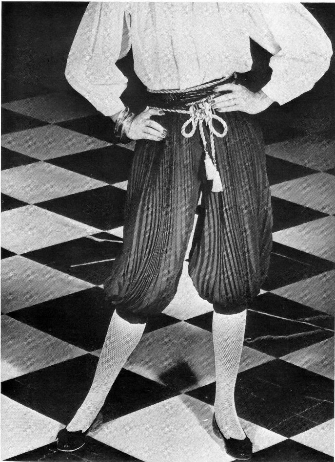
Fischnetze für neue Blickfänge

In Scharen sieht man sie durch den Herbst spazieren, die hübschen weiblichen Unterschenkel, von Kniebundhosen, Knickerbocker, Pagenhosen und Winterbermudas gekrönt. Noch etwas ungewohnt ist ihr Anblick, denn die neue Silhouette verlangt nach einem anderen Gang, nach einer anderen Haltung und nach entsprechenden Accessoires. Den kecken, pagenhaften Schritt verleihen flache Ballerinas oder höchstens Pumps mit kleinen, keilförmigen Absätzen. Und der neueste Hit für die Zone bis zum Knie sind Strümpfe im Fischnetz-Muster, weil sie genau jene Prise Modepiff dazu bringen, die diese eher spitzbübischen Hosen feminin und charmant machen.