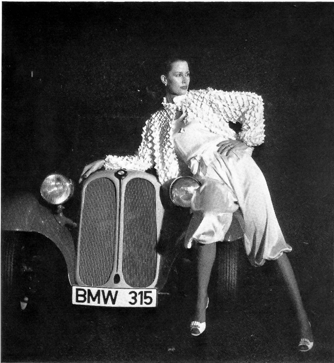
Schweizer Stickerei von JAKOB SCHLÄPFER & CO AG, St. Gallen Modell: CISSULE, Düsseldorf Die grosszügig gearbeitete Jacke mit graphischer St. Galler Stickerei und üppigen Lederapplikationen verleiht diesem Modell seine Extravaganz.

Die turbulente, buntbizarre Nachbarschaft des berühmten Oktoberfestes ist jeden Herbst eine fröhliche Begleiterscheinung der Mode-Woche München. Das schien sogar auf das Modellangebot abgefärbt zu haben, es war farbiger und fantasievoller als in den vergangenen Jahren. Erfolg hatte alles, was im gelungenen Sinn modern und qualitativ hochwertig war – das gab Schweizer Stoffherstellern eine gute Chance.