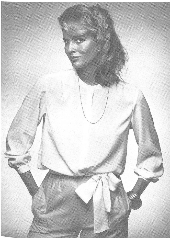
Salopp-elegante Tersuisse-Bluse aus hautfreundlichem und bügelarhemem Georgette mit verdecktem Knopfverschluss, schmalen Hals- und Schulter-Blenden sowie angenähter Gürtel-Schärpe.

TOP QUALITY SWISS MADE – dafür gebührt den Schweizer Hut- und Mützenherstellern volle Anerkennung.