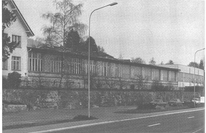
Angrenzend an die Kantonsstrasse der langgestreckte Trakt der Zwirnerei Müller & Steiner AG.

Nähert man sich vom Rickenpass her über Uznach dem oberen Ende des Zürichsees, säumen links und rechts die Durchgangstrasse traditionelle Textilbetriebe, die im besten Sinne des Wortes florieren. Am äussersten Zipfel des Obersees, nach dem Dorfausgang in Richtung Rapperswil, ist rechterhand in Schmerikon die Zwirnerei Müller & Steiner AG in einem langgestreckten Gebäude mit direktem Zugang von der Kantonsstrasse, untergebracht. Vor 75 Jahren ist die Firma gegründet worden - damals als Schifflistickerei.