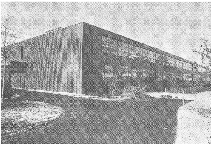
Dreigeschossiger Neubau mit 105 Meter Länge und 14 Meter Breite

Passiert man Herisau, von St. Gallen herkommend auf der direkten Route in Richtung Wattwil und Schwägälp, sind linker Hand vorerst die alten Gebäude der ehemaligen AG Ausrüstwerke Steig sichtbar. Kurz dahinter, auf der rechten Strassenseite, folgen dann die modernen, in markantem Dunkelbraun gehaltenen Betriebsstätten der H. Walser AG. Der letzte der drei Neubauten, die an dieser Stelle in rascher Kadenz errichtet worden sind, ist erst vor wenigen Monaten in Betrieb genommen worden. Die einleitende kurze geographische Standortbestimmung deutet bereits auf die recht bewegte Firmengeschichte hin.