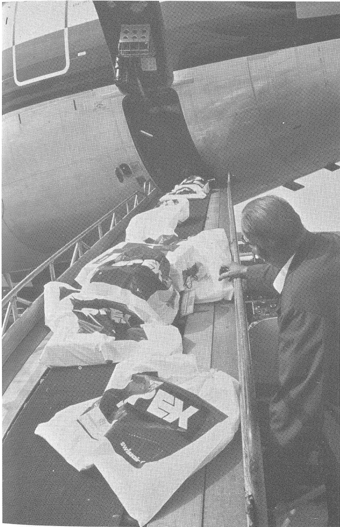
Kurz vor Abflug: Alle SPEX-Sendungen werden zuletzt verladen, damit ein speditiver Auslad und Weiterleitung gewährleistet ist.

Über Nacht werden die Sendungen an den Bestimmungsort geflogen und frühmorgens beginnt die Verteilung der Pakete. Bis spätestens 14.00 Lokalzeit sind alle Sendungen beim Empfänger zu Hause ausgeliefert. Und das nicht etwa nur in den Ballungszentren, im Gegenteil mit SPEX erreichen Sie annähernd 15 000 Ortschaften überall in den USA. Und dies alles mit Laufzeitgarantie, in weniger als 36 Stunden.