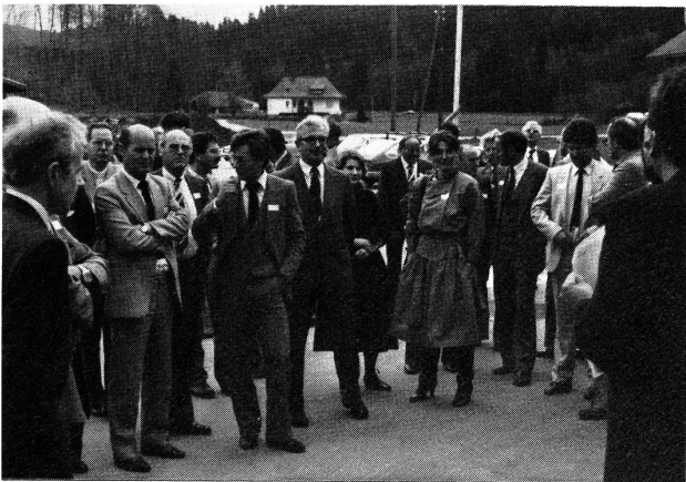
Firma Geissbühler & Co. AG, Lützelflüh