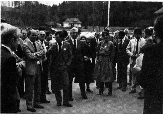
Firma Geissbühler &amp; Co. AG, Lützelflüh