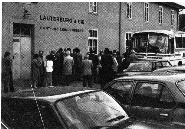
Firma Lauterburg & Cie. AG, Bärau/Langnau i.E.

Schon um 13.00 Uhr versammelten sich die an der GV teilnehmenden Mitglieder unterhalb des Schlosses Burgdorf, wo sie per Car zu Besichtigungen abgeholt wurden. Eine Gruppe besuchte die Firma Lauterburg & Cie. AG, in Langnau, das Heimatmuseum Langnau sowie die Firma Sängler-Leinen AG in Langnau. Einer zweiten Gruppe war Gelegenheit geboten, die Firma Geiser AG, Tentawerke, Hasle-Rüegsau und die Firma Geissbühler & Co. AG, Lützelflüh, zu besichtigen. Die leistungsfähigen Betriebe im Bernbiet, die sich besonders durch einen grossen Spezialitätencharakter ausweisen können, hinterliessen bei den Teilnehmern einen nachhaltenden Eindruck. Frühzeitig wurden die Mitglieder nach Burgdorf zurückgebracht, so dass die Generalversammlung pünktlich beginnen konnte.