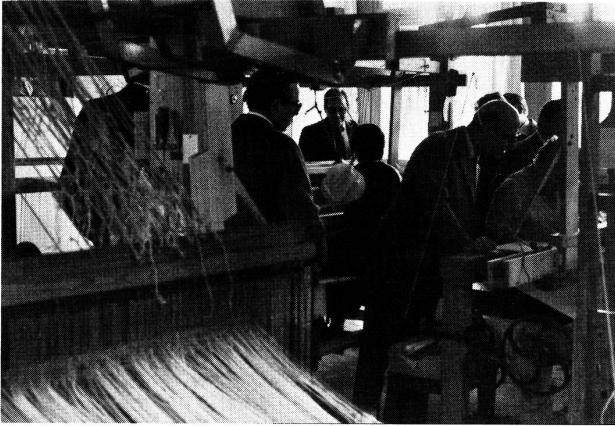
Sänger-Leinen AG, Handweberei, Langnau i.E.