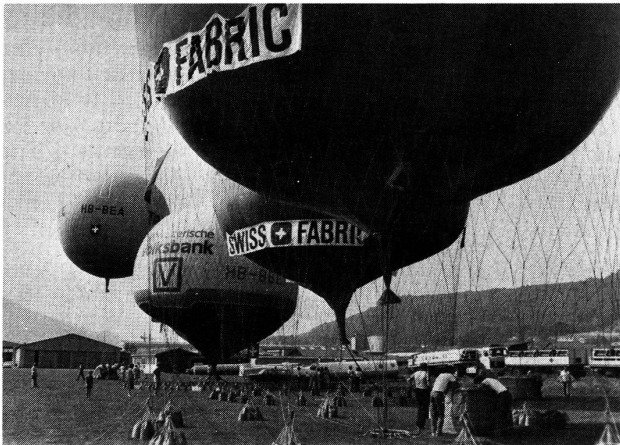
Vor dem Start: 7 Ballone mit 10 000 m 3 Gas

Diese Fahrt musste dann wegen ungünstiger Witterung verschoben werden, worauf der VSTI sie in eine Propagandafahrt für die Stiftung Schweizer Sporthilfe umwandelte. Passagiere waren nun mehrheitlich Spitzensportler und Sportjournalisten. Als Sponsor der Sporthilfe unterstützte der VSTI die Nachwuchsförderung dieser Stiftung – in deren Ausschuss auch alt Bundesrat Fritz Honegger tatkräftig mitwirkt – bereits mit dem Verkauf des T-Shirts «Hopp Schwiiz».