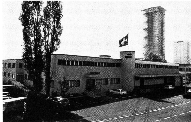
Frontansicht des 1983 erweiterten Hauptgebäudes

Der schweizerische Handstrickgarnmarkt, der auf der Verbraucherebene mit etwa 2,53 Mio. Kilogramm zu veranschlagen ist, weist einige Besonderheiten auf. So teilt sich die Struktur der Anbieter vorerst einmal in eine Gruppe von Herstellern und Manipulanten auf, beide mit Grossistenfunktion. Daneben gelangen Importe über die in der Textilbranche üblichen Kanäle in bedeutenden Mengen auf den Markt. Dieser erste grobe Raster weist bereits auf die Einteilung der Trio Wolle AG, Burgdorf, hin. Das 1946 als Kollektivgesellschaft gegründete und 1974 in eine Aktiengesellschaft übergeführte Familienunternehmen übernimmt mit ihren in 7 Profit-Center gegliederten Warengruppen eine ganze Reihe von Funktionen. Allein am Aufwand für die eigene Creation gemessen, dürfte die Stellung als Manipulant innerhalb der gesamten Firma sehr bedeutend sein.