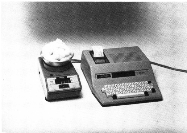
Die oberhalbige elektronische Waage PE 625 ermittelt hochgenau Kardenband-, Vorgarn- und Garngewichte. Über ein Kabel werden die Messwerte an den Tischcomputer PC 100 übertragen, der sie erfasst, verarbeitet und ausdruckt. In Sekundenschnelle errechnet er eine ausführliche Statistik mit CV-Wert.

Die Motor-Messrolle L 201 von Zweigle ist inzwischen zu einem kompletten, preisgünstigen Nummerbestimmungssystem ausgebaut worden. Wer streifenfreie Fertigware durch geringere Nummerstreuung erzielen will, muss während der gesamten Laufzeit der Partie ständig Proben entnehmen und prüfen. Das bringt erheblichen Rechenaufwand mit sich. Er lässt sich umgehen, wenn man den Zweigle Tischcomputer PC 100 einsetzt. Er kann direkt an die oberhalbige elektronische Waage PE 625 angeschlossen werden. Er erfasst alle von der Waage ermittelten Daten automatisch, rechnet sie in das jeweils gewünschte Nummersystem um und druckt die Einzelwerte aus. Ist die vorgewählte Anzahl Tests abgeschlossen, erstellt er die Einzel- bzw. Totalstatistik und falls gewünscht auch ein Histogramm, das die Verteilung der Messwerte um den Nominalwert grafisch