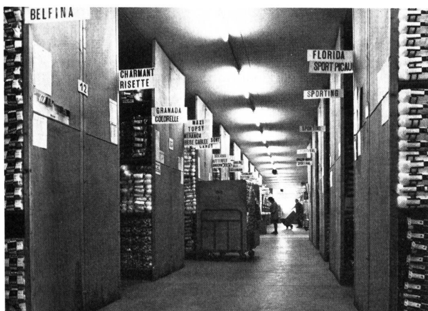
Die Lagerhaltung, die ausschliesslich in verkaufsfertiger Aufmachung erfolgt, wird über EDV gesteuert und kontrolliert