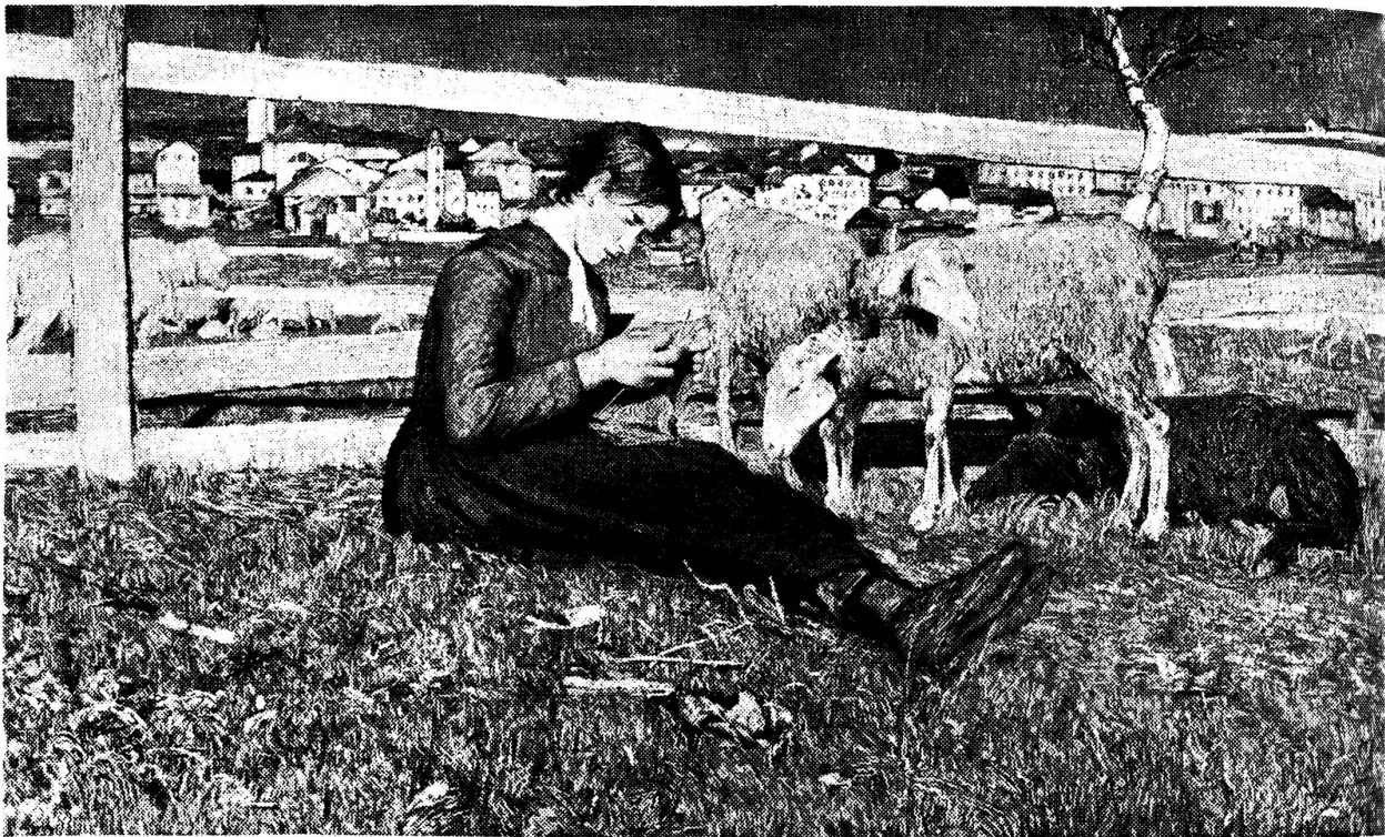
Strickendes Mädchen Ölgemälde von Giovanni Segantini, 1888, Kunsthaus in Zürich

Netzholz und Bambusstäbchen waren die Vorfahren der heute üblichen Stricknadeln aus Draht. Anfänglich waren es Männer, sogenannte Hosenstricker, die das unter der Rüstung getragene Beinkleid (Strümpfe) anfertigten. Wie andere Handwerker, so schlossen auch sie sich in Gilden (Zünften) zusammen, die dann die Ausbildung, die Anfertigung der Ware, den Handel und die Preise regelten und bestimmten.