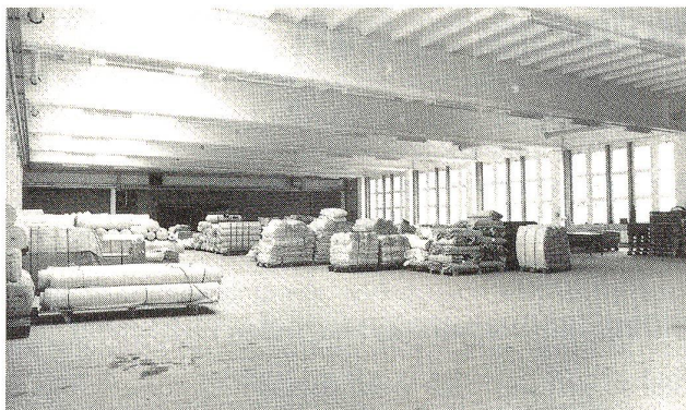
Die säulenlose Halle wird ad interim als Lager benutzt, ist jedoch für Nassveredlungszwecke eingerichtet

Die neue Halle, in der sich die Gäste an einem sehr guten Bauernbuffet verpflegen konnten und wo der Vertreter der aargauischen Regierung sowie Peter Fischer sen. die Anwesenden begrüsst, erstreckt sich auf einer Grundfläche von 43 auf 25,5 Meter. Mitte 1983 wurde der Auftrag zu diesem Neubau im Rahmen eines zweigeteilten Investitionsplans dem Architekten erteilt. Das Bauvorhaben sah die Erstellung eines Hochregallagers und eines Fabrikationsgebäudes vor. Die Halle wurde als erste Etappe zur Ausführung bestimmt. Ende August wurde mit dem Abbruch des alten Lagergebäudes und Mitte September mit den Bauarbeiten begonnen. Die totale Bauzeit betrug nur 6 Monate, so dass bereits Mitte März 1985 die ganze Halle fertiggestellt wurde. Sie ist als säulenfreie, vorgefertigte Konstruktion aus vorgefertigten Trägern und Dachplatten konzipiert, was, wie der Architekt festhielt, wesentlich zur kurzen Bauzeit beitrug. Der Boden ist mit Kieskoffer und Asphaltbelag versehen, was den nachträglichen Einbau von Leitungen, Bodenkanälen etc. ermöglicht. Für einen günstigen Wärmehaushalt hat man für die Oberlichtkuppeln eine speziell isolierende Verglasung gewählt, dazu kommt die Dreifachverglasung der Fenster. Aus Spannrahmen-Ab-