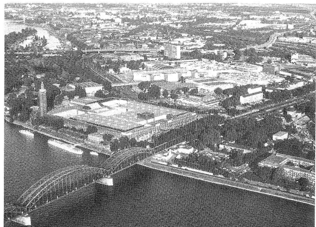
Messegelände der Internationalen Köln-Messe

Zum 1. Mal ist die Schweizer Modemacher-Gruppe SAFT (Syndicate for Avantgarde Fashion Trends) vom 16. bis 18. 8. 1985 zu Gast bei der Internationalen Herrenmodewoche Köln.