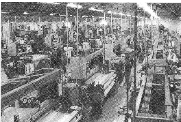
Websaal mit Rueti-Luftdüsenwebmaschinen T-strake

Die Produktionsweise, die Hugo Elsener als ausserhalb der schweizerischen (Baumwoll-)Webereinorm bezeichnet, erfolgt äusserst flexibel. Wendigkeit wird daher auch von den Garnlieferanten erwartet. Ausgehend von bestimmten Basismaterialien, also Garnketten und Schussgarnen sowie einem relativ grossen Rohgarnlager, verfolgt die Tessitura ein Angebotskonzept, das sich rasch auf die Kundenwünsche einstellt und somit einen hohen Bereitschaftsgrad aufweist. Der Garnverbrauch erreichte 1984 total 830 000 Kilogramm, der weitaus überwiegende Teil Polyamid-Endlosgarne. Der Baumwollanteil bezifferte sich auf 180 000 Kilogramm.