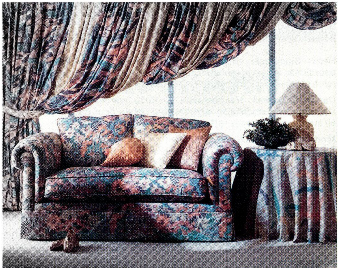
Sofa: Secret Garden 618 Tischtuch: Graffiti 518 Vorhang: On the Rocks 718

Hot-Line – Still-Life – Fandango – On the Rocks – Secret Garden und Graffiti (100% Baumwolle – 140 cm breit) entsprechen einem Trend nach fröhlichen, lebensbejahenden Mustern und Farben; ein Ausdruck voller Dynamik und Energie.