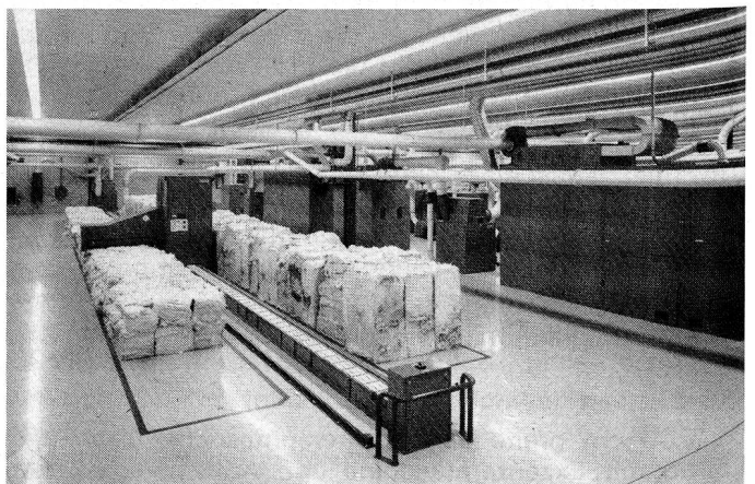
Der Rieter Unifloc A1/2, das vollautomatische Ballenabtragsystem, löst Ihre Putzereiprobleme.

Im März 1986 hat die Maschinenfabrik Rieter AG, CH-8406 Winterthur, 33 komplette Putzereinlinien verkauft.