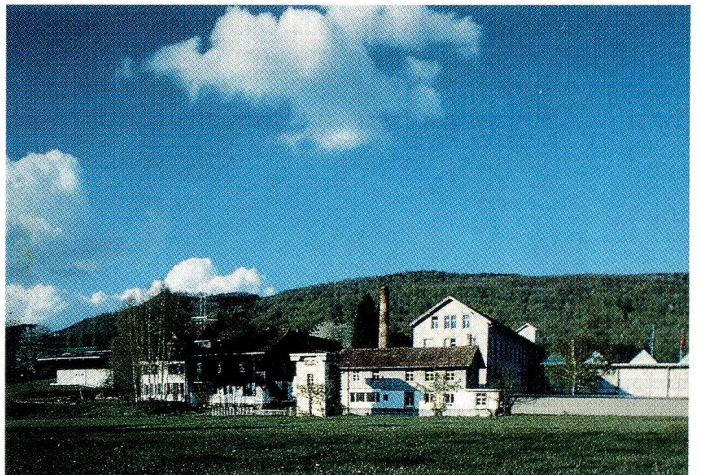
Die 1825 gegründete Seidenweberei Weisbrod-Zürrer AG, Hausen am Albis