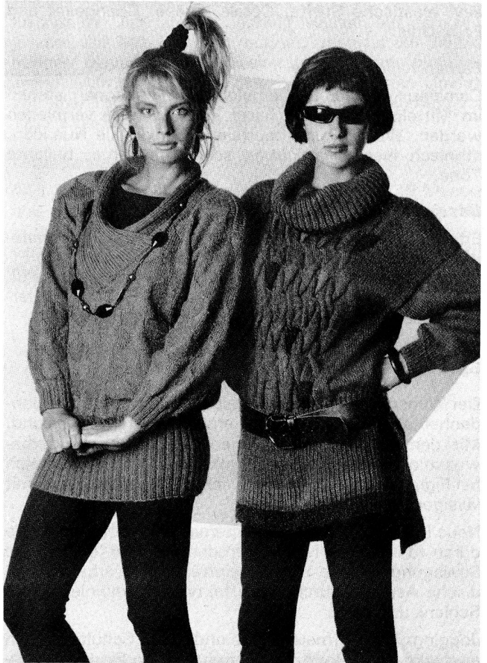
Aparte Strickmodelle, fabriziert aus der neuen Qualität Rendez-vous von Schaffhauser Wolle.