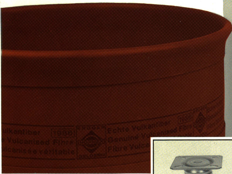
aus echter Vulkanfiber