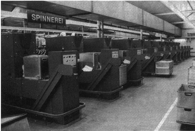
Neue Gruppe Rieter-Spinnmaschinen mit Doffer