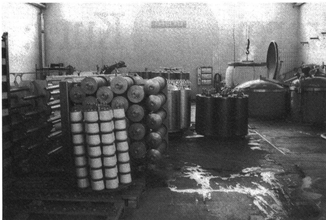
Die Färberei ist für Kammzüge, sowie für Kreuzspulen, Muff und Strang konzipiert.

Zum vorzüglichen Fazit der Unternehmenstätigkeit hat mit Sicherheit auch der hohe Investitionsrhythmus beigetragen, vor allem in den letzten Jahren. So sind die einzelnen Maschinengruppen gemäss Produktionsfluss überall dort, wo Verbesserungen möglich waren, auf den letzten Stand der Technik gebracht worden. So etwa bei den NSC-Finisseuren, im Bereich der vier neuen Schlafhorst-Autoconer zu je 40 Spindeln, in der Spinnerei mit einer neuen Gruppe Rieter-Spinnmaschinen mit Doffer und total 13600 Spindeln und selbstverständlich auch in der Färberei. Letztere ist im Verlauf der letzten acht Jahre vollautomatisiert worden, was u. a. die Mikroprozessorsteuerung und eine integrierte Farblösestation umfasst. Zudem bringt diese Automatisierung, das Personal beschränkt sich praktisch auf das Be- und Entladen, eine sehr hohe Reproduktionssicherheit. Ge-