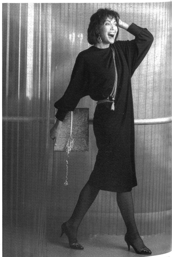
Das aktuelle «Kleine Schwarze» mit asymmetrischem Tunika-Effekt aus Tersuisse-Jersey mit Wollbeimischung.

Modell: Alpinit AG, 5614 Sarmenstorf Accessoires: Imodac AG, CH-8952 Schlieren Schuhe: Bally, CH-5012 Schönenwerd