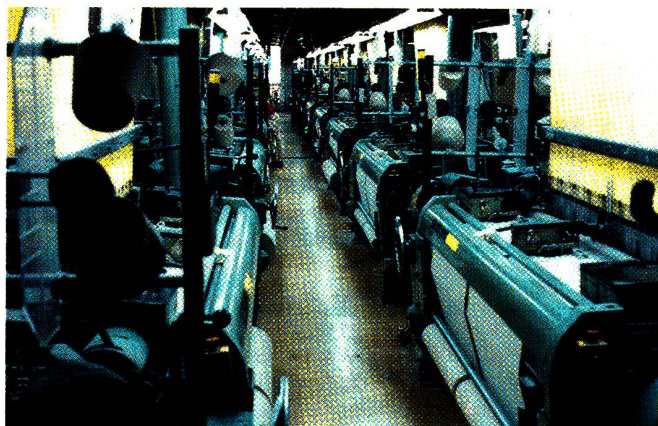
Die moderne Jacquard-Weberei

Gebr. Maag Maschinenfabrik AG CH-8700 Küsnacht/Schweiz Tel. 01/9105716, Telex 825753, Fax 01/9100675