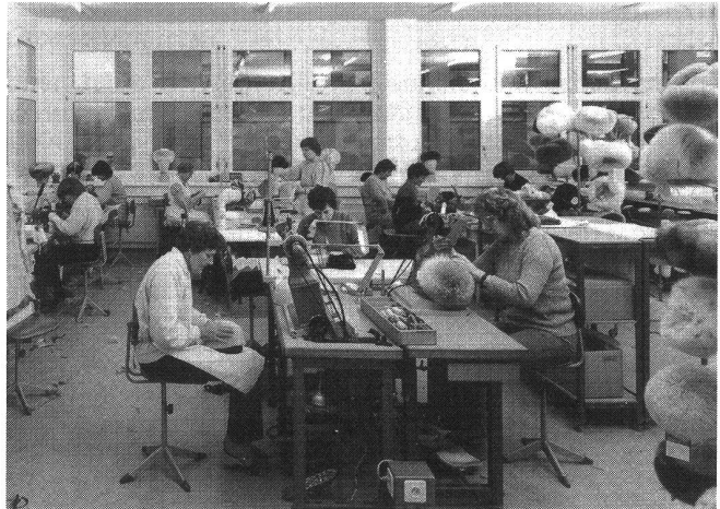
Atelier: Handfertigung von Langhaarpelzhüten Charles Muller SA

1986 beschäftigt Charles Muller SA insgesamt 30 Personen, zu denen zusätzlich 50 Heimarbeiterinnen kommen.