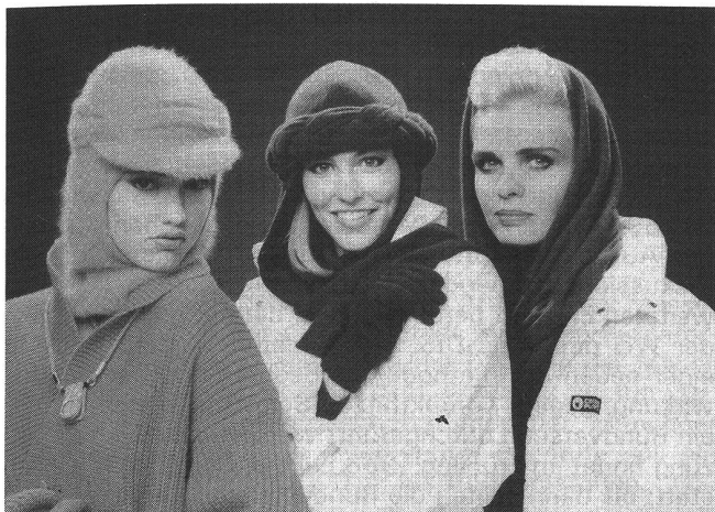
Links: Cagoule als Unterform. Darüber drapiertes Stirnband mit Schild. Mitte: Schaltuch mit Kragen. Darüber Zopfstirnband. Rechts: Grosszügiges Schaltuch mit Kragen. Alle Modelle Angora-Jersey (farblich assortiert)