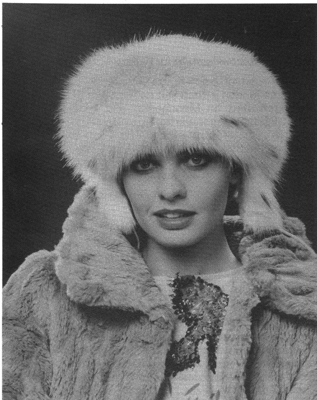
Auf Luchs eingefärbte Shadowfuchs-Toque mit Kopfplatte aus Angora-Jersey. Die ausklappbaren Ohrenpatten aus Fellklauen können unter dem Kinn gebunden werden.